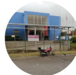
Ágora de la infancia San Juan