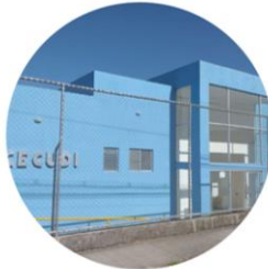
Ágora de la infancia San Miguel