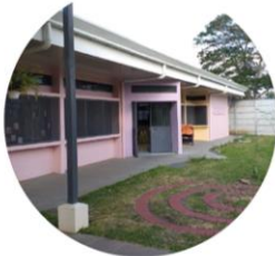
Ágora de la infancia Alajuelita