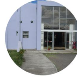
Ágora de la infancia Loto