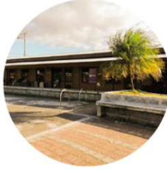
Centro infantil municipal Hatillo