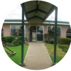
Centro infantil municipal Pavas