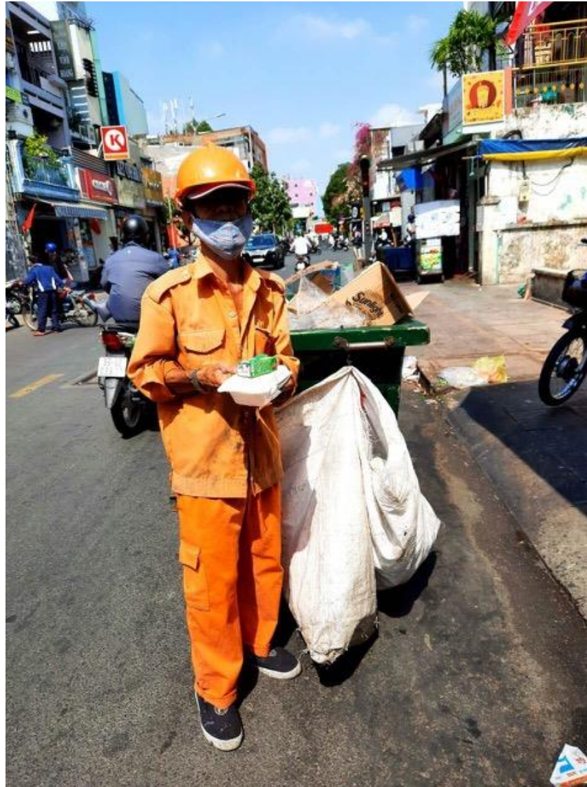
Take away lunch box