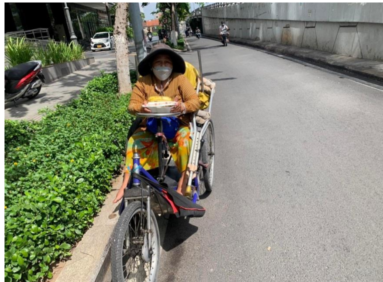
Supporting meals to students, disabilities and street vendors