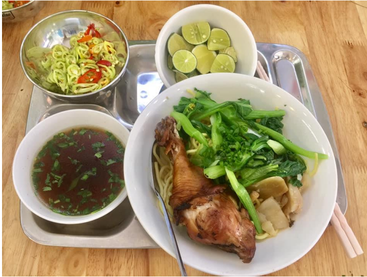
Set of lunch only 1.000 – 2.000 VND